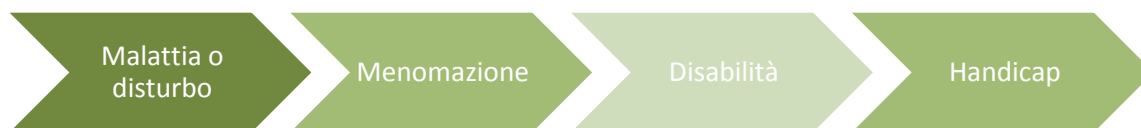
Figura 1 Visione sequenziale del modello ICDH

Non è quindi possibile comprendere del tutto la portata innovativa dell'ICF nel panorama delle classificazioni dell'OMS se non si approfondisce il gap oggi esistente tra la visione contemporanea del concetto di salute dell'OMS e l'approccio allo stesso concetto operato dall'ICD-10 .